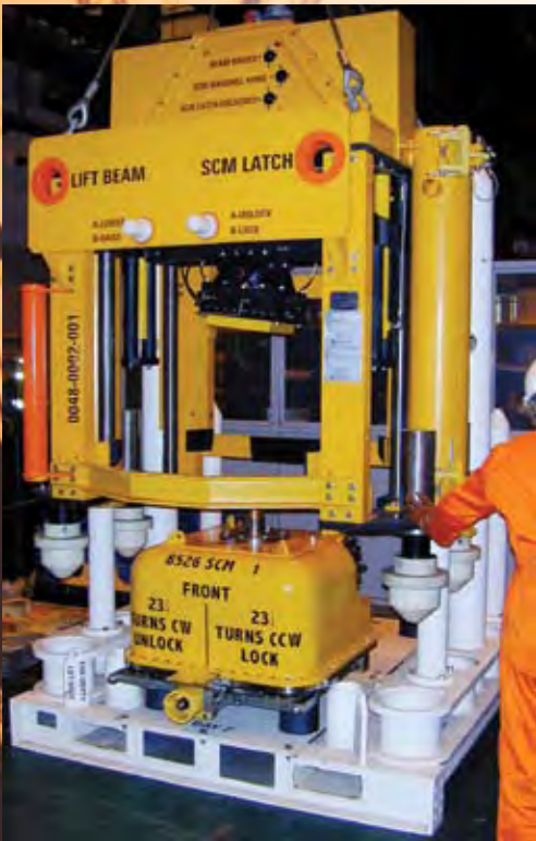
Herramienta de Corrida SCM