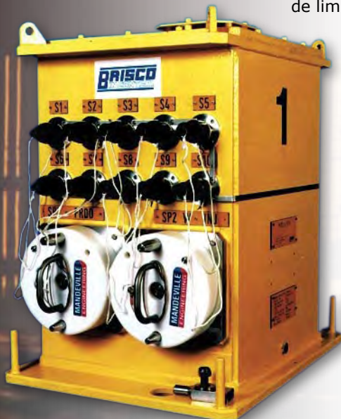
SEM instalado en SCM

Se puede acomodar un acumulador dentro del módulo de control para ayudar a prevenir caídas de presión durante operaciones de válvula en tramos largos; de manera alternativa, también se pueden proveer módulos acumuladores submarinos por separado para mantener los niveles locales de presión.